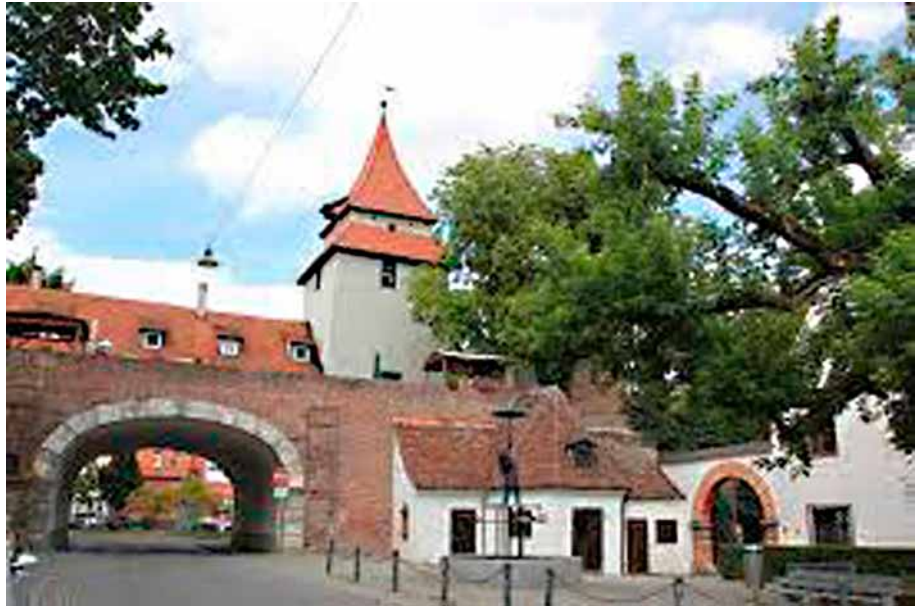
Seel- oder auch Zundeltor.

mal fünf mittelalterlichen Ulmer Stadttore erhalten geblieben.